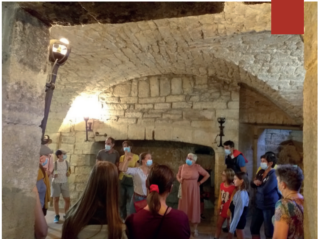
Ancienne cuisine du château