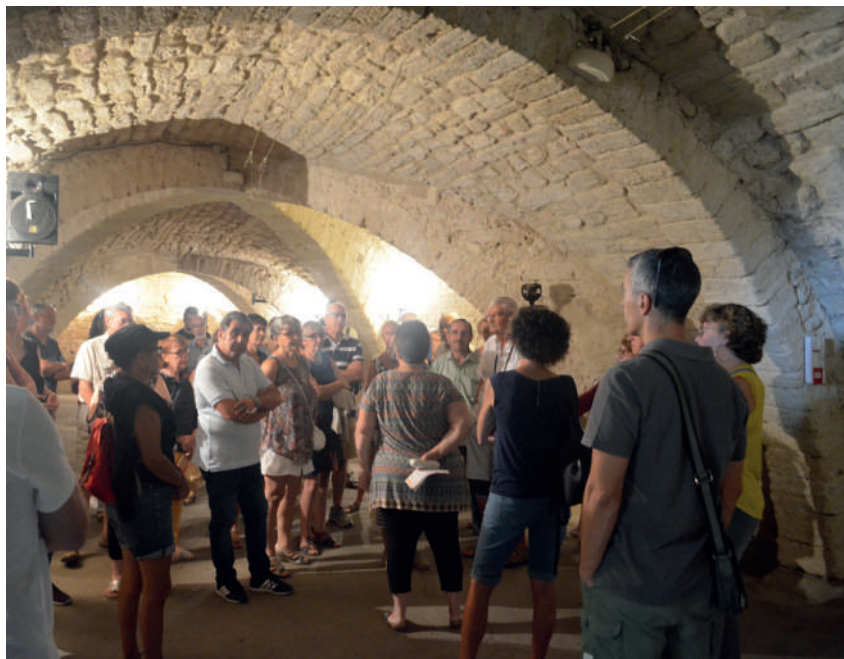
© Visite du château lors des journées du Patrimoine

Les Galopins, quant à eux, seront transportés dans le monde des pirates et des sirènes. Le thème de la gourmandise sera également à l'honneur.