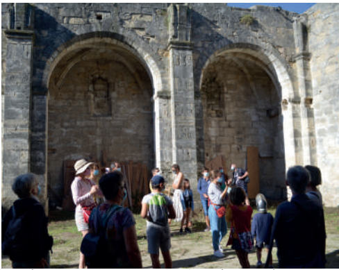
Découverte de la chapelle des pénitents à ciel ouvert