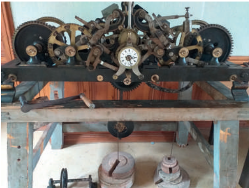
Ancienne horloge du village exposée dans la salle du conseil