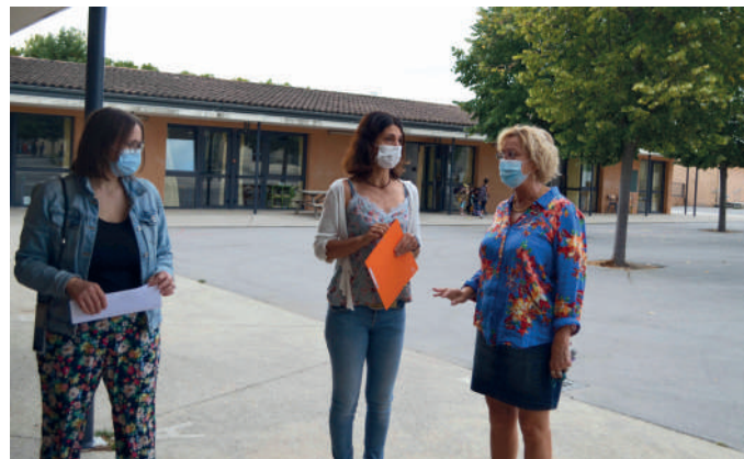
Mme le Maire (à droite) accompagnée de deux institutrices de l'école Lucie Aubrac

à plusieurs centaines d'élèves et d'assurer le soutien de la municipalité pour cette nouvelle année aux directrices et directeurs des classes élémentaires et maternelles.