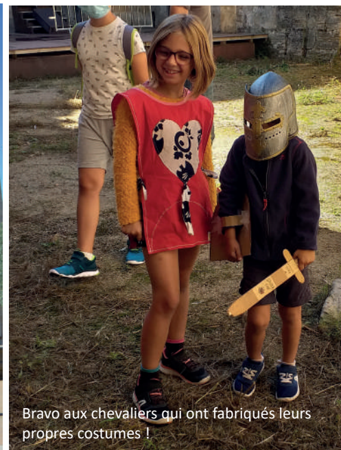
Bravo aux chevaliers qui ont fabriqués leurs propres costumes !